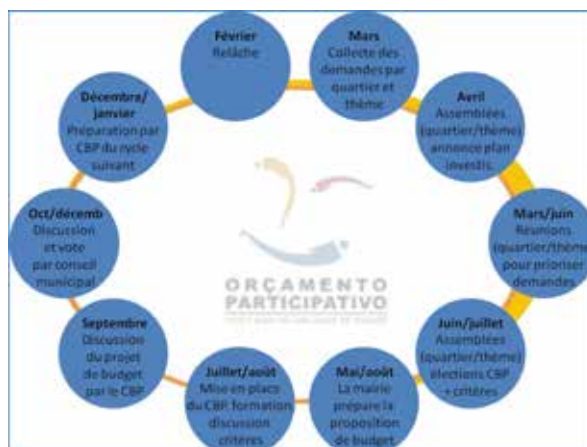
Le cycle annuel du budget participatif de Porto Alegre 36

Sur base de ces trois niveaux, le cycle du budget participatif se conçoit traditionnellement comme suit :